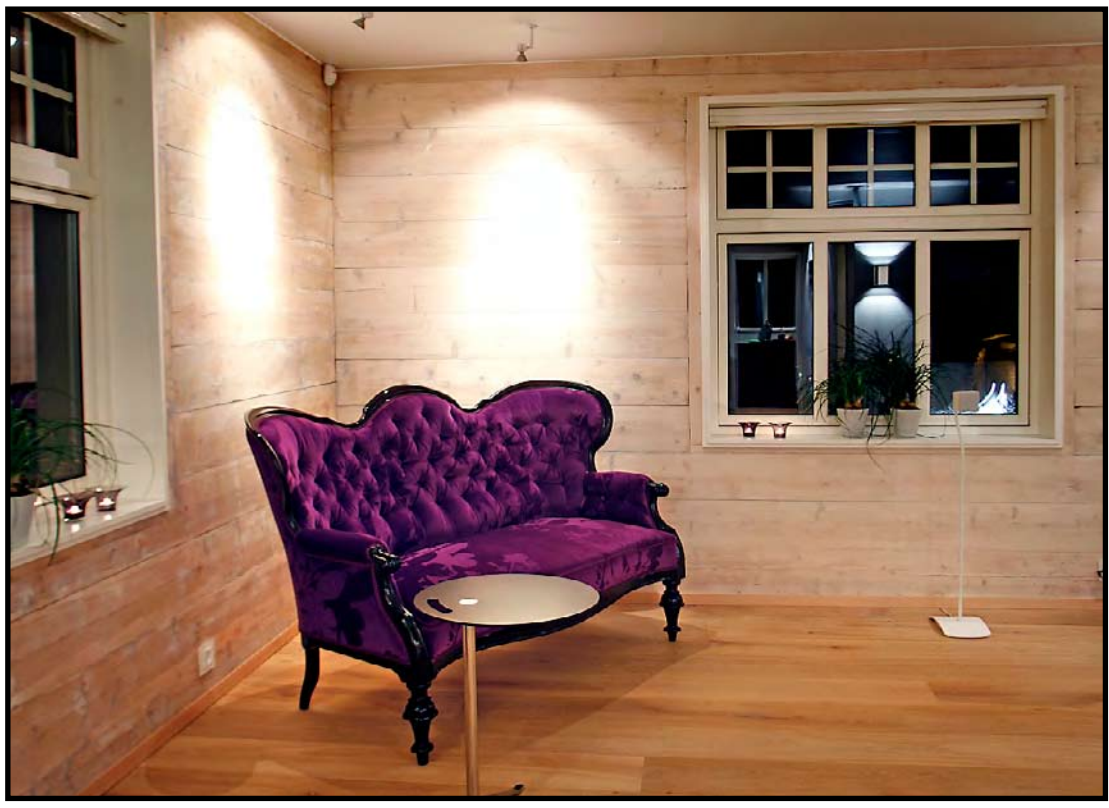
NYTT OG GAMMELT: I hele huset er gammel design blandet med nyere design. Denne lilla Biedermeier-sofaen i stuen er fra ca. 1840.