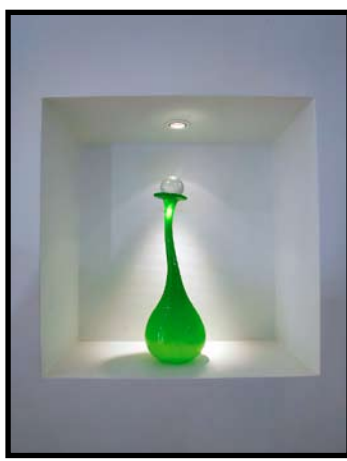
FARGERIKE DETALJER: Grønne, lilla og oransje detaljer går igjen i hele huset.