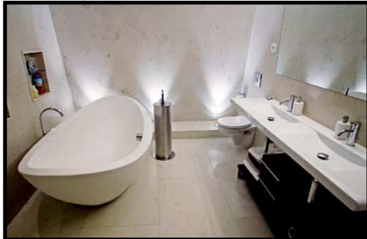
MARMOR: Badet i tredje etasje er kledd i fliser av italiensk marmor.