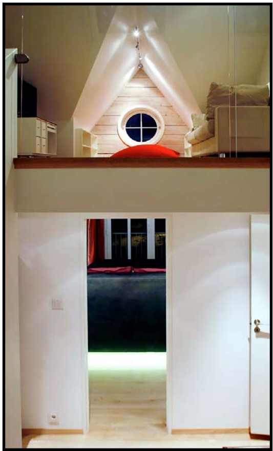
ÅPENT: Etasjene ligger som hemser oppover. Det gir huset et luftig og åpent preg.