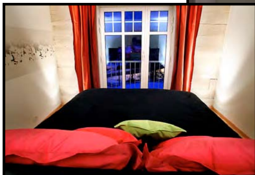
SOVEROM: I andre etasje finner vi soverommet.