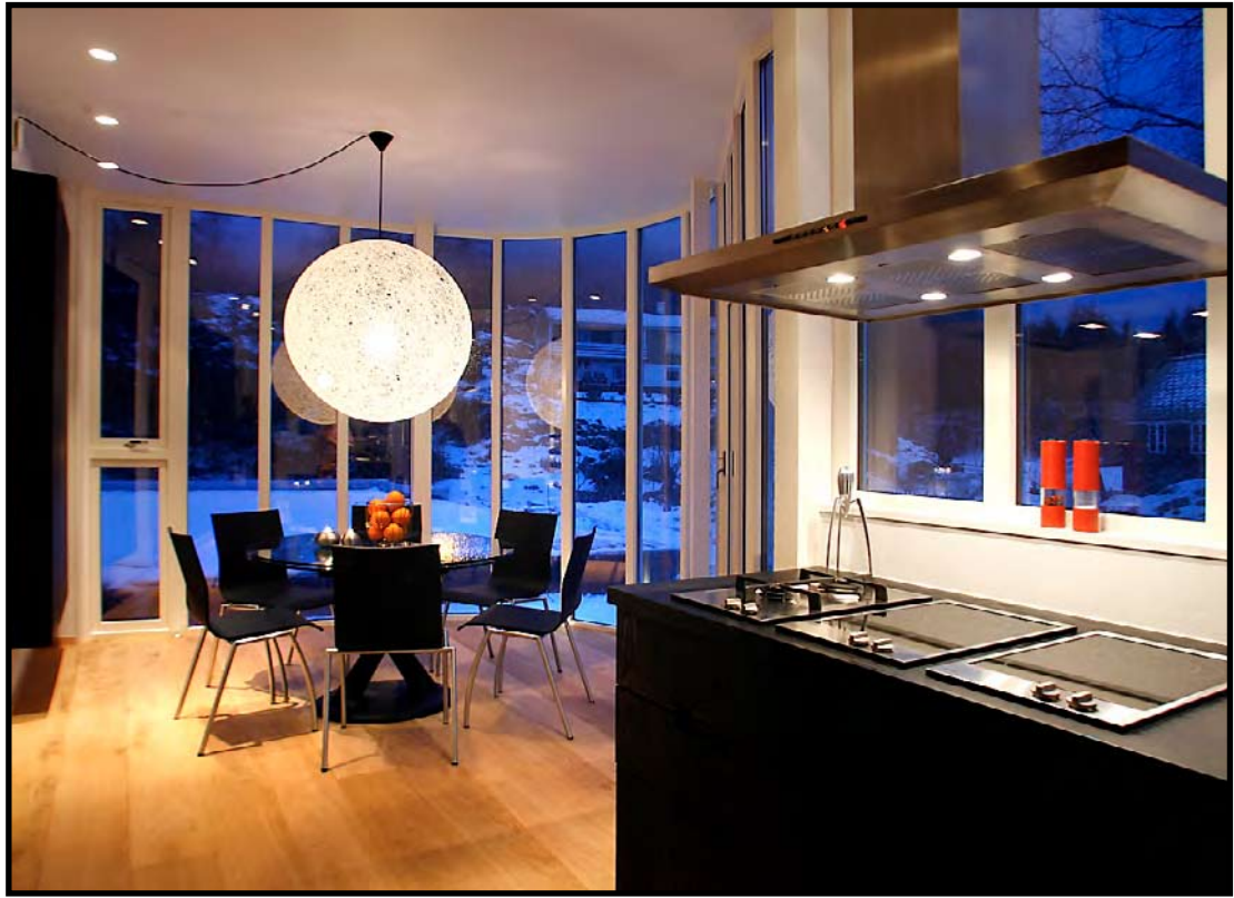
PRAKTISK OG LEKKERT: Moooi-lampen er blikkfang på kjøkkenet. Det runde bordet kan slås ut så det blir større. Kjøkkenet er fra CPH Square Kitchen.