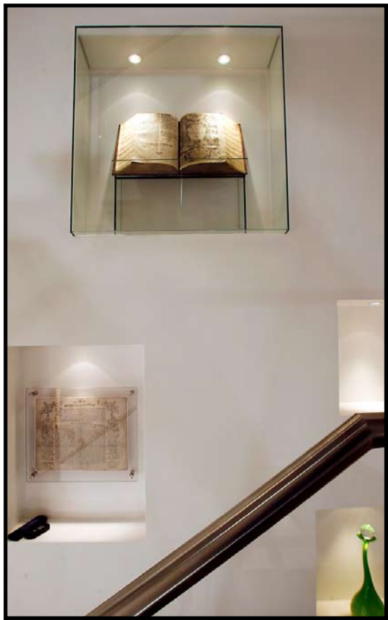
GAMMEL BIBEL: Den flere hundre år gamle bibelen har fått en fin utstillingsplass på veggen i gangen.