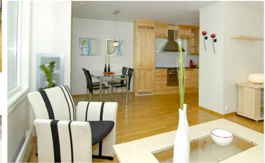
KLAR FOR VISNING: Leiligheten etter at stylistene har lagt siste hånd på verket.

”Folk vil gjerne kjøpe boligen din, men de vil ikke kjøpe hjemmet ditt.”