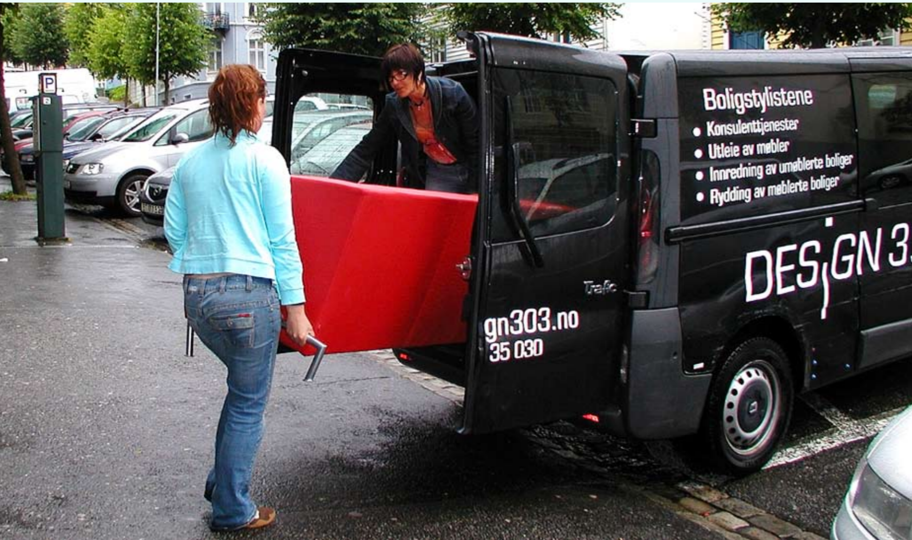
TUNGE TAK: En rød sofa, lamper, vaser og andre pyntegjenstander medbringes fra stylistenes lager.